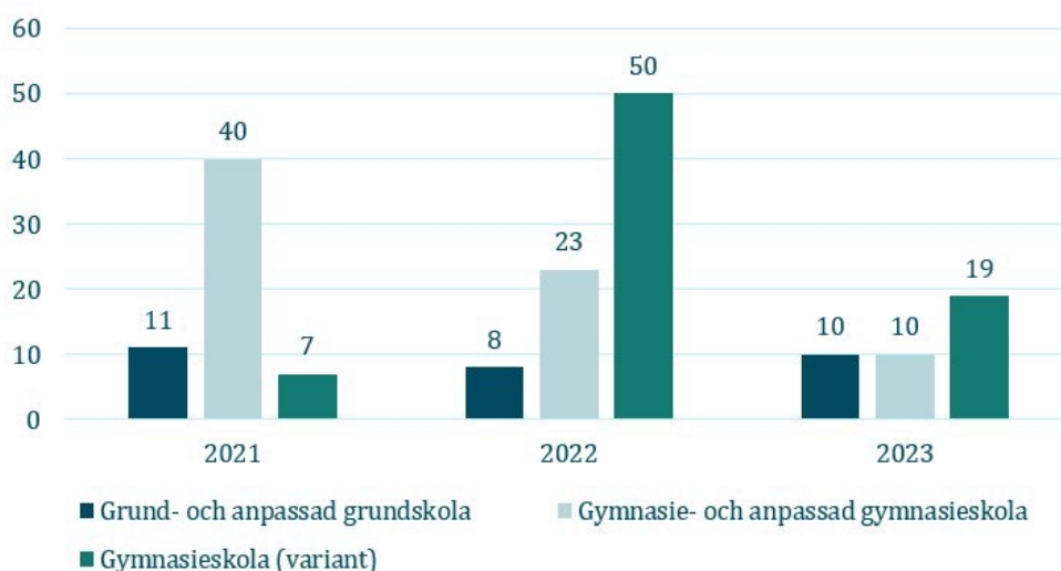
Diagram 3- Antal godkända ansökningar om utökning fördelat på skolform, 2021-2023