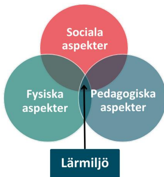
Figur 1. De tre aspekterna i skolans lärmiljöer

Skolans lärmiljöer består av pedagogiska, sociala och fysiska aspekter. Alla dessa aspekter behöver vara tillgängliga för att lärmiljön ska bli tillgänglig. I granskningen har därför alla tre delar ingått, och redovisas under separata rubriker.